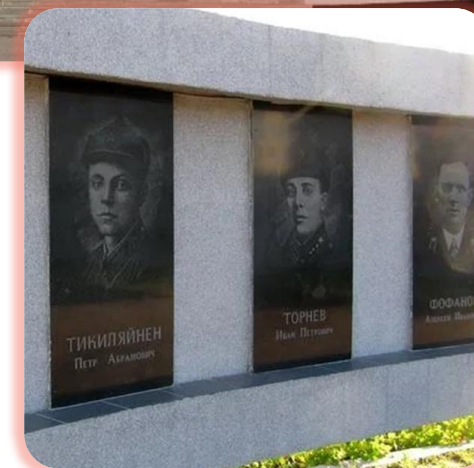
Галерея Героев Советского Союза в Петрозаводске